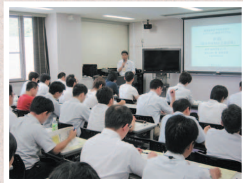
2011.8.8開催：「地域企業若手技術者向け イノベーション研修(第1回)」の様子